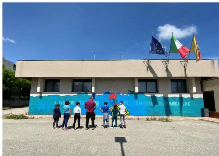
Progetto grafico Antonino Meo

Dal 1992 l'Istituto Arrupe, unico in Italia, è parte della rete internazionale Sylff, composto attualmente da 69 Università e Centri di ricerca presenti in 44 Paesi in tutto il mondo ( www.sylff.org ).